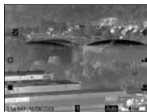
Zivil- und Katastrophenschutz