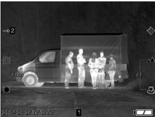
Identifikation von Personen vor einem Fahrzeug