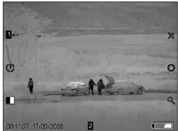
Überwachung und Aufklärung