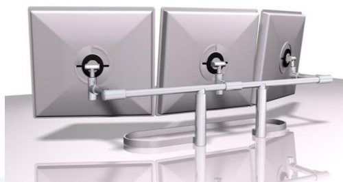
Zubehör zur Adaption: Relings