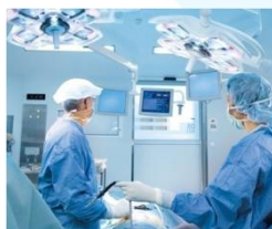
Medical & Dental Solutions

Haben Sie noch Fragen oder wünschen Sie weitere Informationen? Ein kurzer Anruf oder eine E-Mail genügt! Unser Team steht Ihnen jederzeit zur Verfügung und unterstützt Sie gerne mit einem individuellen Angebot.