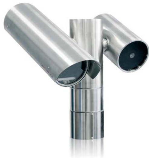
ARGUS-System – Hochgeschwindigkeit mit Präzision