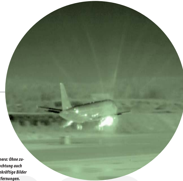
Wärmebildkamera: Ohne zusätzliche Beleuchtung auch nachts aussagekräftige Bilder über große Entfernungen.